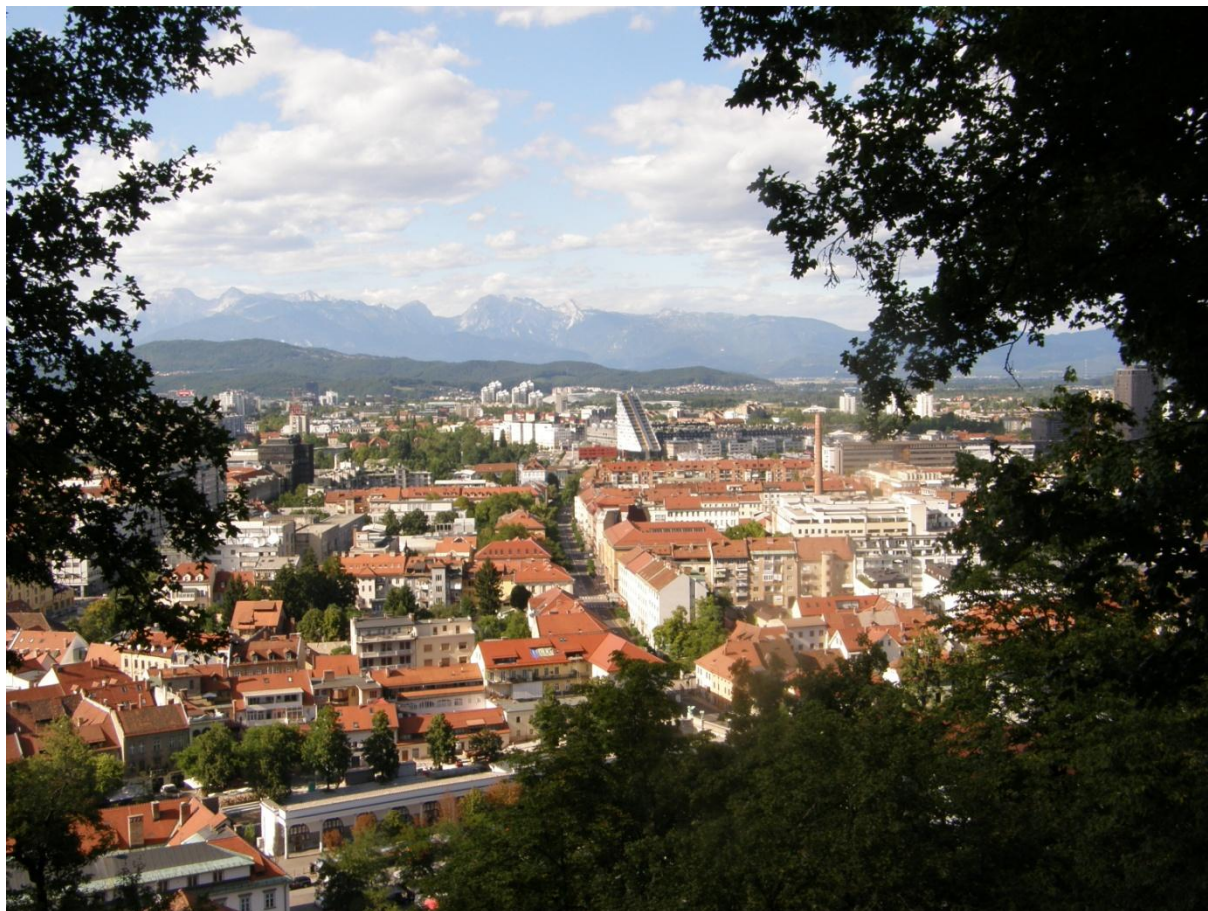
Výhled z hradu

Náš první stop byl ředitel řiditel Slovinské Toyoty ve svém Priusu. Byl hrozně milý a vzal nás až do centra Lublaně. Lublaň je skvělé město. Z jejich hradu, (který je tedy nic moc) uprostřed města, je úžasný výhled nejen na Lublaň, ale i na Alpy tyčící se za městem. Nejvíc nás však zaujala cesta na kraj města na stop. Procházeli jsme lesoparkem, čínžáky se změnilly na vesnické domečky a podél cesty byly prameny s pitnou vodou a to vše, co by kamenem dohodil od centra jejich hlavního města. Ten den jsme spali v lese za benzinkou asi 10km za Lublaní.