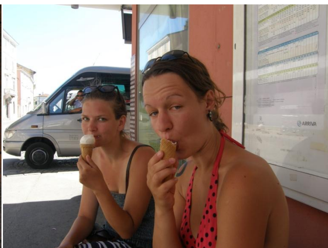
Plněné kalamáry a zmrzlina - mňam