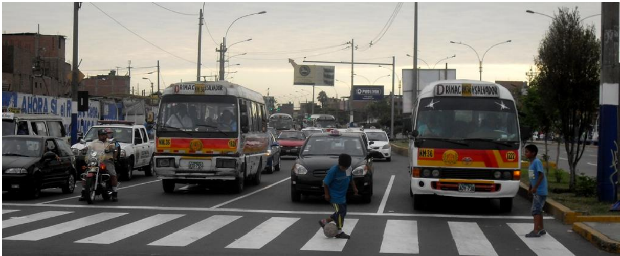
Proč si nezahrát fotbal uprostřed silnice...